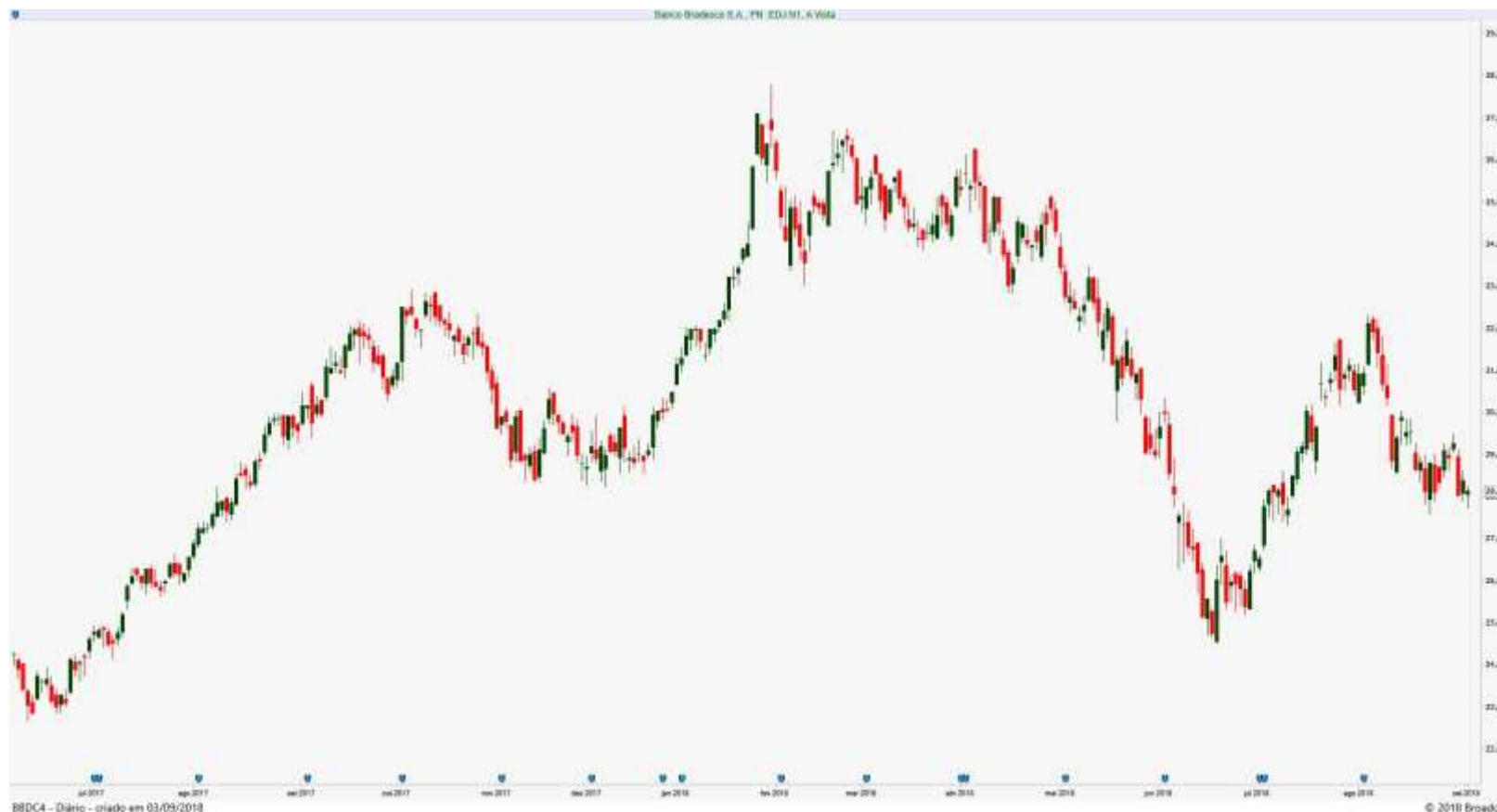
Gráfico Diário de BBDC4 – Bradesco PN

O Petróleo subiu de novo (2,2%), o que fez com que as ações da Petrobras destoassem do clima negativo do Mercado. Já o Minério de Ferro na China segue apresentando lenta e progressiva queda nas cotações (0,4% - aproximadamente), mas desta vez as ações da Vale tiveram um desempenho muito inferior ao da sua commodity, corrigindo a disparada anterior.