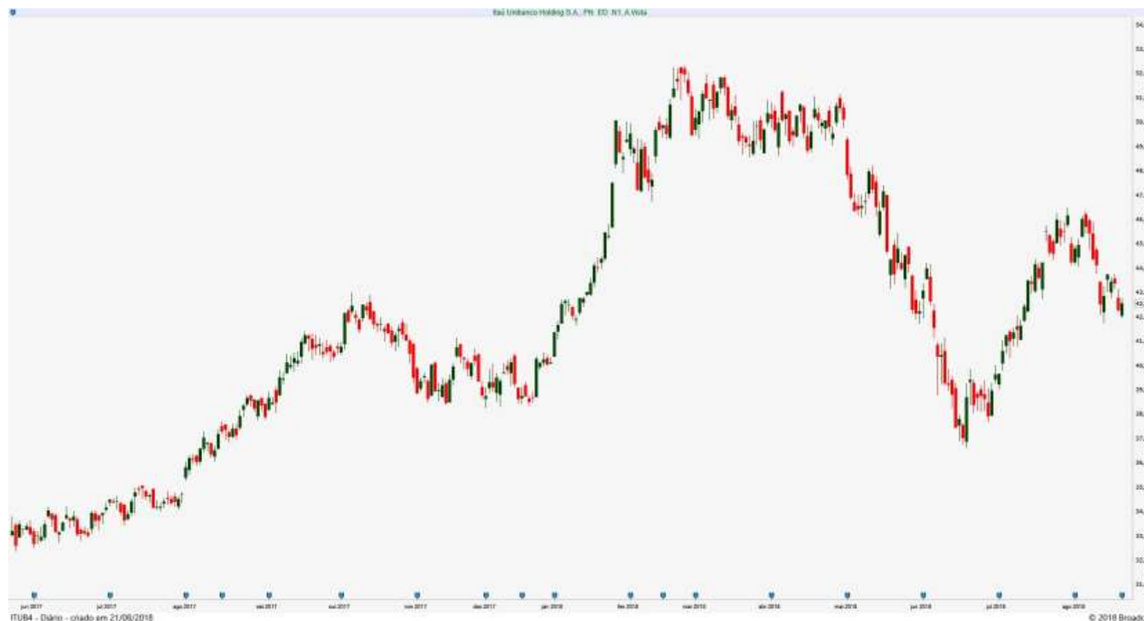
Gráfico Diário de ITUB4 - Itaú/Unibanco PN

O Petróleo teve outra baixa (1,0%), o que explica parte (mas não tudo) da queda das ações da Petrobras. Já o Minério de Ferro na China foi no mesmo caminho (0,9% - aproximadamente), com as ações da Vale também registrando baixa.