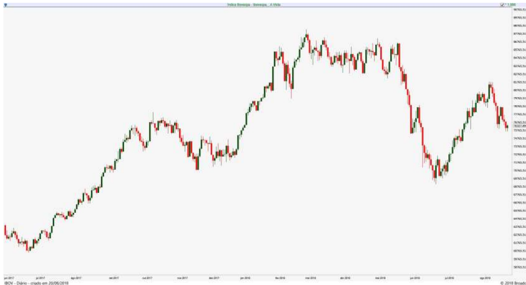
Gráfico Diário do Índice Ibovespa