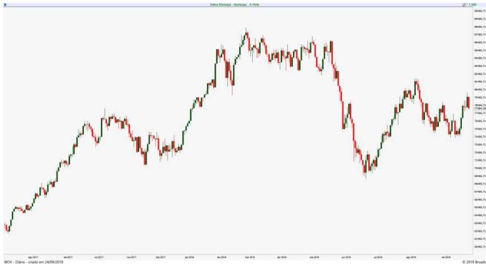
Gráfico Diário do Índice Ibovespa