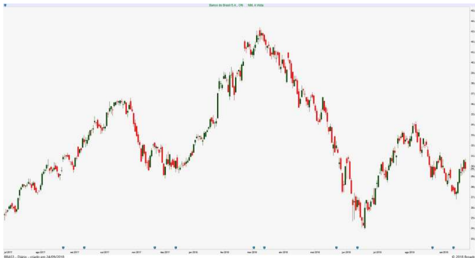
Gráfico Diário de BBAS3 – Banco do Brasil

O Petróleo disparou com a negativa da OPEP em elevar a produção ( 4,5% ), impulsionando as ações da Petrobras que, no entanto, subiram menos do que a sua commodity (talvez o “risco político” esteja pesando sobre a estatal neste momento). Já o Minério de Ferro na China novamente apresentou leve alta ( 0,2% - aproximadamente), mas as ações da Vale ignoraram isso e tiveram uma disparada meteórica, acompanhando o movimento das principais mineradoras do exterior.