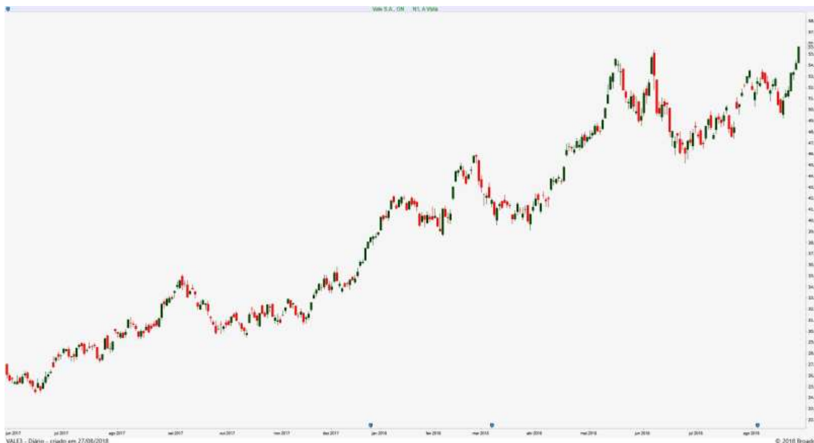
Gráfico Diário de VALE3 - Vale

O Petróleo disparou (5,9%), o que teve efeito limitado sobre as ações da Petrobras. Já o Minério de Ferro na China teve nova correção (0,8% - aproximadamente), mas as ações da Vale ignoraram isto completamente e apresentaram a maior alta do período (talvez refletindo a desvalorização cambial).