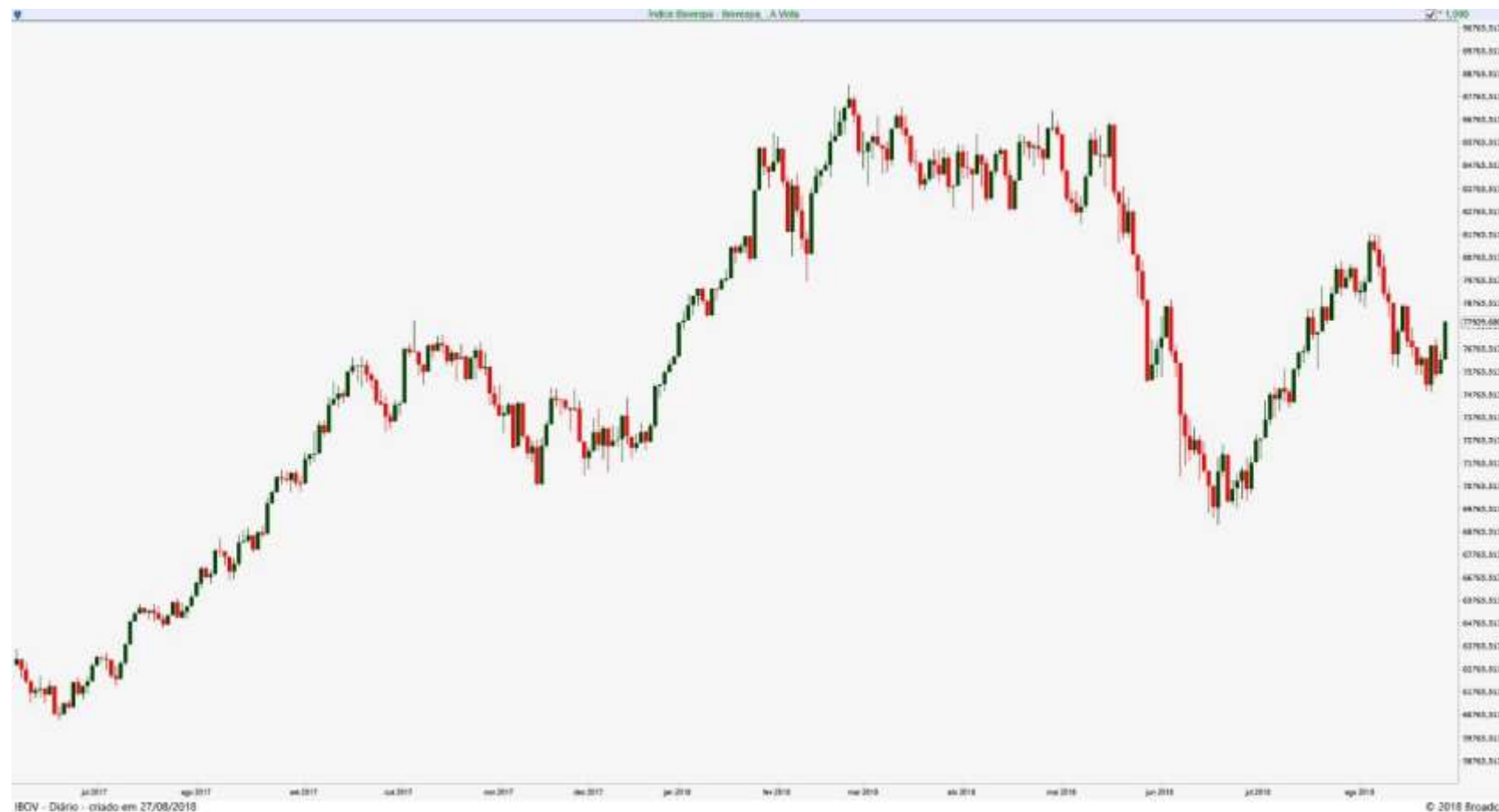
Gráfico Diário do Índice Ibovespa